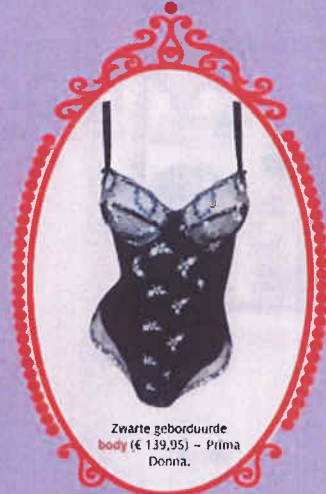
Zwarte geborduurde body (€ 139,95) - Prima Donna.

▲ paars satijnen jurkje met slip (€ 19) - C & A. Diadeem met pomponnetjes (€ 17,50) - Fries & Company.