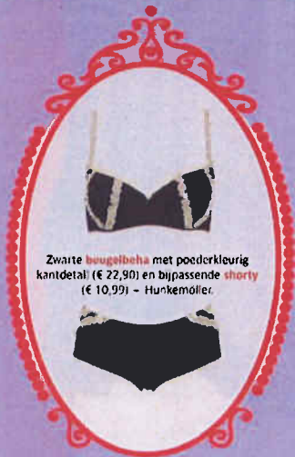
Zwarte beugelbeha met poederkleurig kantdetail (€ 22,90) en bijpassende shirty (€ 10,99) - Hunkemöller.