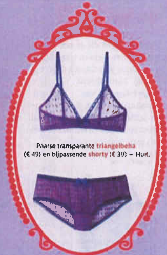
Paarse transparante triangelbeha (€ 49) en bijpassende shirty (€ 39) - Huit.